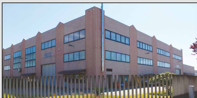
Filiale di Galliate - Galliate Branch

A great reality in the universe of machine tools construction: from the beginning ITAMA has always headed for the attainment of a main objective: satisfy the multiple and various requirements in the field of machine tools, not privileging any field in particular but taking into consideration both small activities and cycles of great production. The availability of ITAMA to assist its customers for every technical problem places it like reliable point in the mechanic field. Sales in the world-wide level have had an exponential increase and today ITAMA can count on agents of primary importance in the fields of their competence.