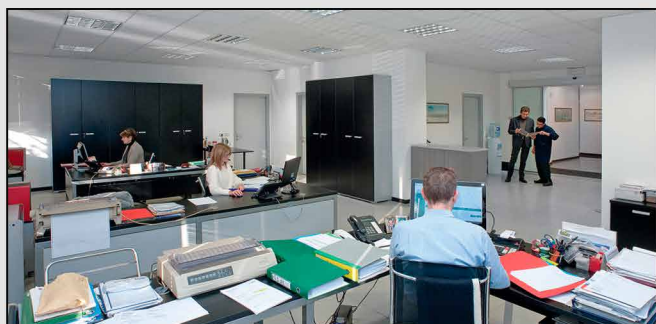
Sede di Turbigo - Headquarters Turbigo